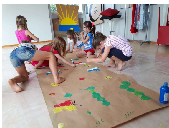
Sala III "Studio 23"