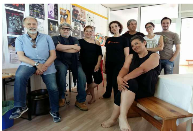
Sala II - Ufficio / Break time Disponiamo di un ampio bagno ma non di doccia e non acqua calda