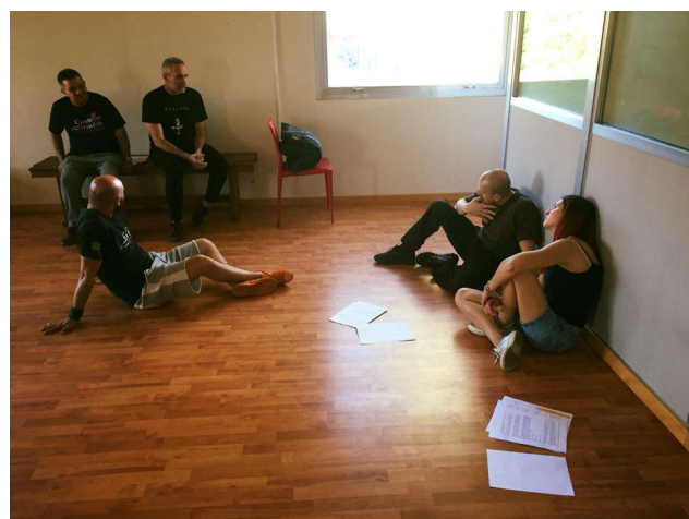
Sala I - Principale (completa di pannello per proiettore ed impianto musicale con casse) La sala principale dispone di aria condizionata fredda e calda)